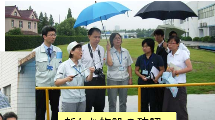
新たな施設の確認