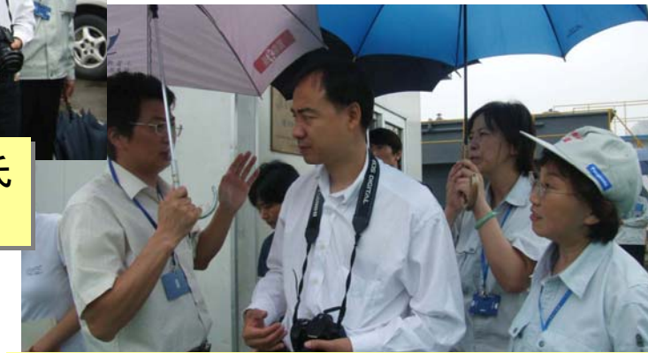
NGOの基準による第三者審査 を行った上海環境科学院代表との交流

最終確認会議後、環境NGO約20団体の合意を経て 8月、同ホームページから当社名を削除（5000社中で初）