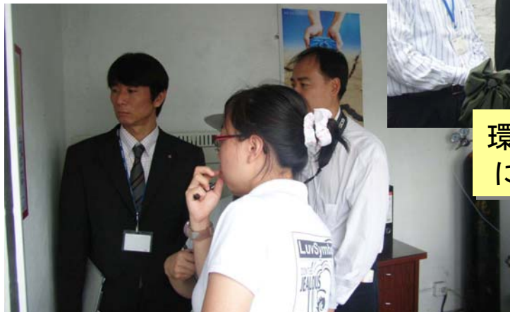
オンライン排水監視測定システムの確認